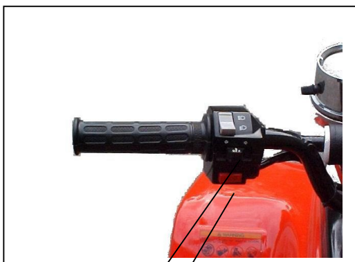
Knap 1 Startkontakt