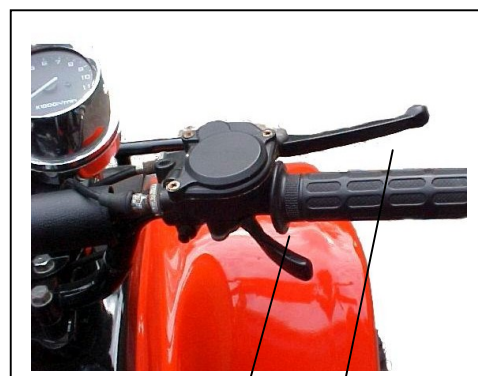
Gas greb Forbremse